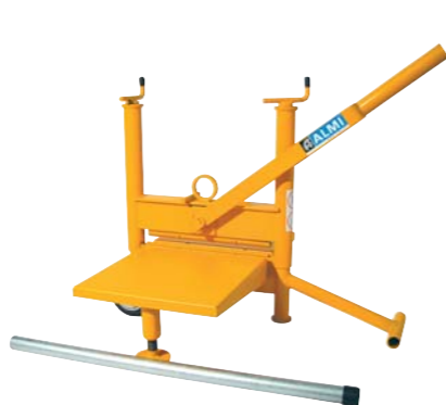
De 43UT met vergrote draagplaten voor bijvoorbeeld kalkzandsteen.