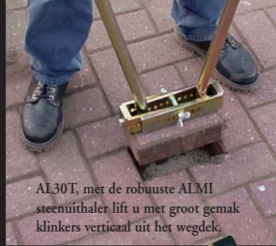
AL30T, met de robuuste ALMI steenuithaler lift u met groot gemak klinkers verticaal uit het wegdek.

De steenknipmachines van ALMI zijn een wereldwijd begrip in de wegenbouw. De merknaam ALMI staat volgens onze klanten voor de beste kwaliteit, een probleemloze werking en de langste levensduur. ALMI brengt een compleet assortiment steenknippers op de markt voor zowel bestratingsindustrie als de kalkzandsteenverwerking. Als u kiest voor ALMI dan kiest u voor een nederlands kwaliteitsproduct waarmee wereldwijd de meeste stratenmakers werken.