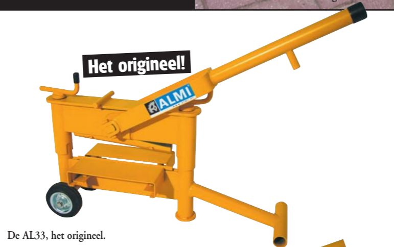
De AL33, het origineel.

ALMI steenknippers zijn niet alleen verkrijgbaar in handbediening, maar ALMI heeft ook een aantal gepatenteerde elektrohydraulische steenknippers ontwikkeld, waardoor met één druk op de knop de steen geknipt is. De AL 43SH, uitgevoerd met de flexibele "S" messen, is zeer geschikt voor vlakke of enigszins kromme tegels, straatstenen en stenen met een onregelmatig oppervlak (tot 4mm). Deze machine kent een drukkracht van 14.000 kilo. Voor dit type is ook een vast mes leverbaar. Voor het zware werk levert ALMI de AL 43SH21. Deze hydraulische krachtpatser met vast mes levert 21.000 kilo drukkracht.