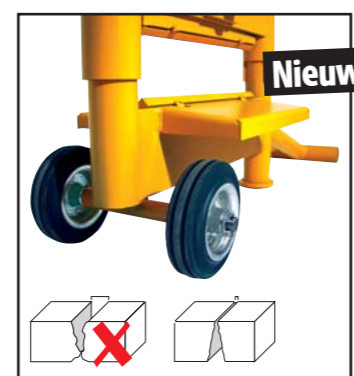
De AL33D, met schuine, vaste draagplaat voor het strakkere straatwerk.