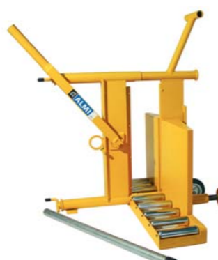
De AL65KS voor het knippen van kalkzandsteen.