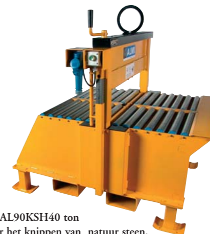
De AL90KSH40 ton voor het knippen van natuursteen.