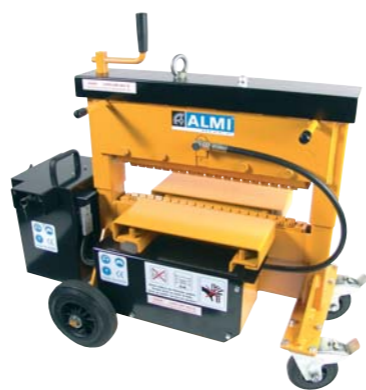
AL43SH, sneller en arbo-vriendelijk bestraten.