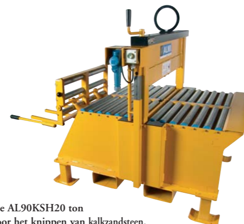
De AL90KSH20 ton voor het knippen van kalkzandsteen.